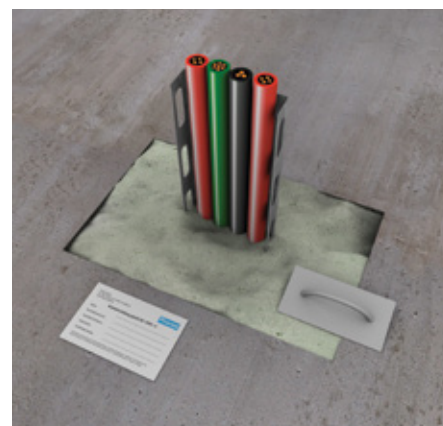
6. Poravnajte površinu. Pričvrstite identifikacionu oznaku.

Više detalja o izvođenju zaptivki za prodore kablova, cevi i kanala potražite u klasifikacionom izveštaju.