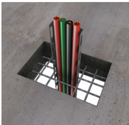
2. Kod izvođenja protivpožarnih zaptivki u podovima, ugradite gvozdene šipke od 100 mm. Ove šipke se moraju postaviti u centar protivpožarne zaptivke od maltera, na svakih 300 mm, ali minimalno po jedna šipka sa svake strane, pri čemu 50 mm šipke treba da bude umetnuto u pod a 50 mm prekriveno protivpožarnim malterom PROMASTOP®-M. Za ugradnju u zid nisu potrebne gvozdene šipke.