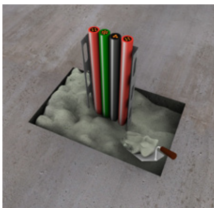
5. Zatvorite preostali otvor malterom PROMASTOP®-M. Uzmite u obzir sleganje maltera kod prodora većih dimenzija, što zahteva doradu kako bi se postigla tačna debljina ili visina.