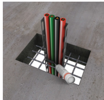
3. Nanesite PROMASEAL®-AG za kablove i kablovske snopove.